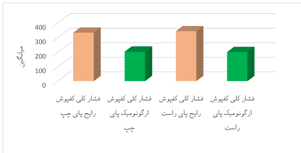
نمودار ۱. مقایسه فشار کلی در پای راست و چپ در دو سطح مختلف