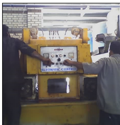
تصویر ۱: نمایی از دستگاه دیامپلس ساب

در نهایت با توجه به بررسی متون علمی معتبر و مقالات موجود و نیز تولید صدای بالای دیامپلس کنترل صدای دیامپلس با روش محفظه نیمه محصور با توجه به تعمیرات احتمالی دستگاه پیشنهاد شد. محفظه پیشنهادی به ابعاد 1/8 \times 1/55 \times 1/5m^3 ، از جنس فولاد گالوانیزه و زنگ‌نزن به ضخامت 0/55 \text{ mm} و چگالی 6 \text{ kg/m}^3 (هرچه دانسیته سطحی مواد بیشتر باشد، بر اساس قانون جرم، افت انتقال در آنها بیشتر است. از طرفی با افزایش ضخامت دیواره افت انتقال به صورت لگاریتمی افزایش پیدا خواهد کرد؛ لذا فولاد بیشترین چگالی سطحی را از میان مواد مورد انتخاب داراست)، که از قسمت پشت دارای دریچه بازدید و از قسمت جلو دارای