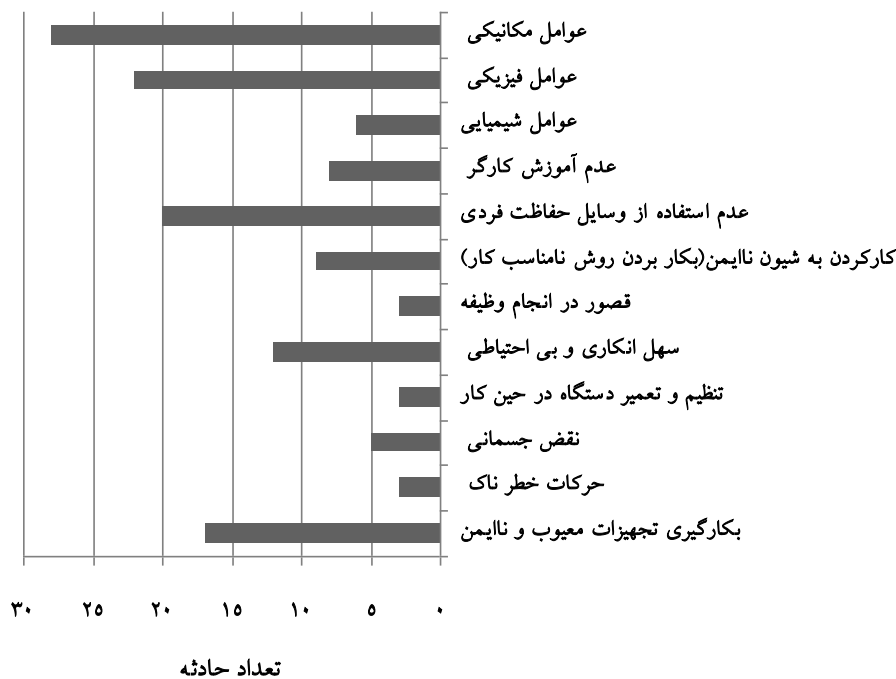
نمودار ۲- عوامل موثر بر اعمال نایمن و شرایط نایمن در جنگل‌های ساری در طی سال‌های ۹۰-۸۸

چشم با ۱۸ مورد در رتبه سوم و بقیه اعضای بدن در رتبه‌های بعد قرار دارند (نمودار ۳).