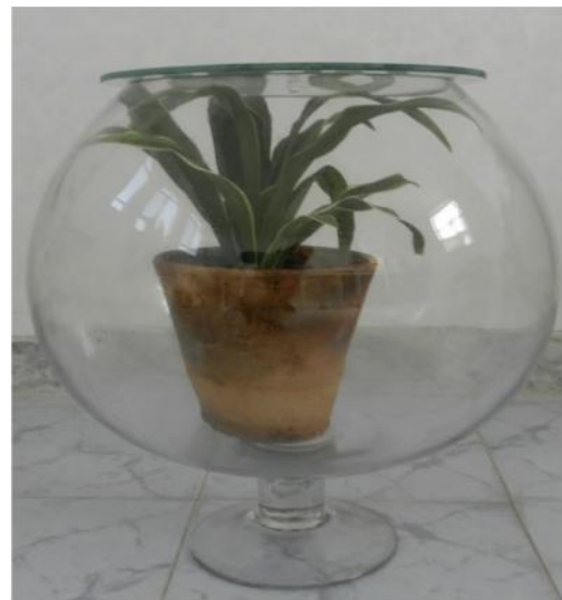
شکل ۱: نمای از اتاقک

به منظور کمک به گردش هوا و نمونه‌برداری واقعی‌تر از هوای اتاقک، فن ۱۲ وات در مرکز اتاقک قرار داده و قبل از هر نمونه‌برداری به مدت نیم ساعت روشن می‌گردید (شکل ۱).