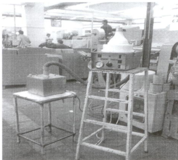
شکل ۱- دستگاه نمونه‌برداری در حال نمونه‌برداری از هوای داخل سالن

ابتدا پلیت‌ها و کلیه وسایل نمونه‌برداری به وسیله الکل اتیلیک ۹۶٪ تمیز و استریل شده و به مدت ۱۵ دقیقه در دمای ۱۳۴ درجه سانتی‌گراد درون اتوکلاو قرار گرفته تا استریل شوند. حجم نمونه برای برآورد میانگین از فرمول n = \frac{2(Z_{1-\alpha/2} + Z_{1-\beta})^2 S^2}{d^2} به دست آمد (۲۰). تعداد نمونه‌های محیطی با استفاده از روش مذکور در هر