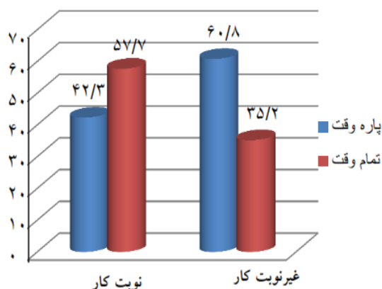
نمودار ۱- توزیع فراوانی وضعیت اشتغال افراد نوبت کار و غیرنوبت کار

در این مطالعه بین نوبت کار و غیرنوبت کار بودن با نمره استرس از لحاظ آماری ارتباط معناداری وجود