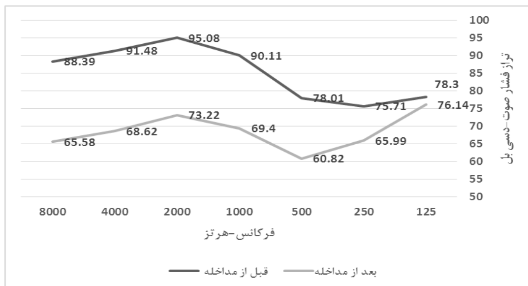
شکل ۳: مقایسه تراز فشار صوت منبع قبل و بعد از مداخله در فرکانس‌های اوکتاوی