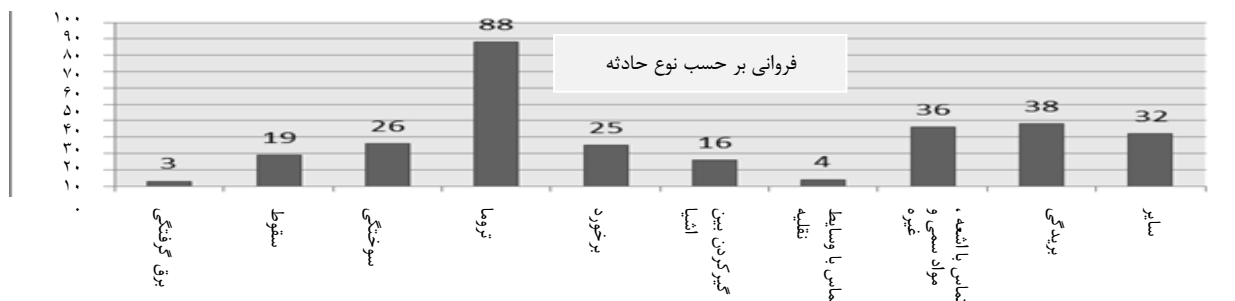
نمودار ۲: فراوانی بر حسب نوع حادثه در نیروگاه سیکل ترکیبی یزد

بریدگی (۱۳/۲٪) و تماس با اشعه، مواد سمی و غیرسمی (۱۲/۵٪) بوده و کمترین شیوع حوادث نیز با توجه به تولید نیروگاه که برق با ولتاژ بالا می باشد، از نوع برق گرفتگی با میزان ۱ درصد بوده