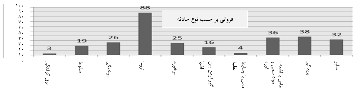
نمودار ۲: فراوانی بر حسب نوع حادثه در نیروگاه سیکل ترکیبی یزد

بریدگی (۱۳/۲٪) و تماس با اشعه، مواد سمی و غیرسمی (۱۲/۵٪) بوده و کمترین شیوع حوادث نیز با توجه به تولید نیروگاه که برق با ولتاژ بالا می باشد، از نوع برق گرفتگی با میزان ۱ درصد بوده