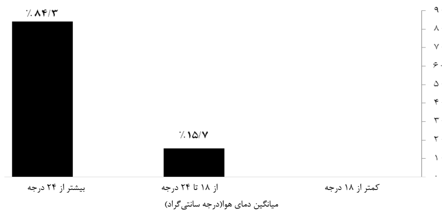
نمودار ۲: درصد فراوانی کلاس‌ها در هر محدوده دمایی