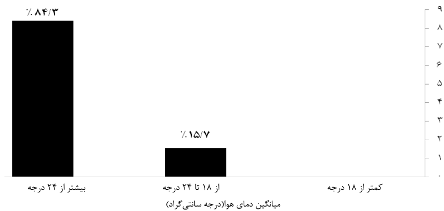
نمودار ۲: درصد فراوانی کلاس‌ها در هر محدوده دمایی