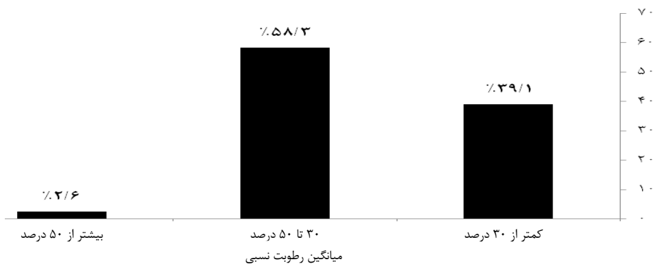
نمودار ۳: درصد فراوانی کلاس‌ها در هر محدوده از رطوبت نسبی