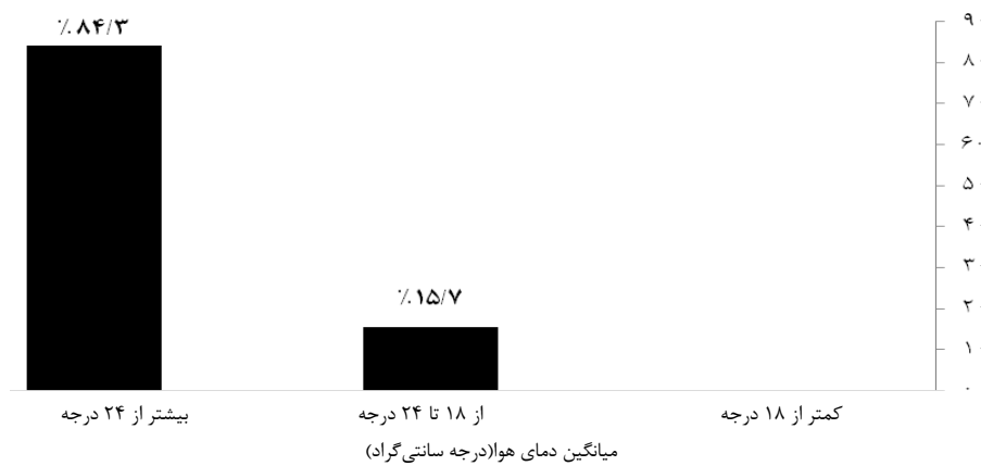
نمودار ۲: درصد فراوانی کلاس‌ها در هر محدوده دمایی