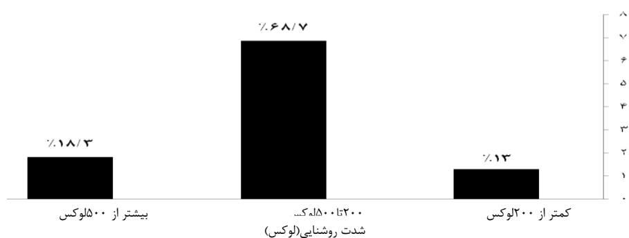
نمودار ۱: درصد فراوانی کلاس‌های درس در هر محدوده روشنایی با توجه به مقادیر استاندارد ملی

مطابق نتایج در ۸۷٪ از نمونه‌ها شدت روشنایی در کلاس بیش از حداقل مقدار الزام شده در استاندارد ملی (۲۰۰ لوکس) می‌باشد. در مقایسه نتایج به دست آمده با استاندارد ارائه شده توسط جامعه مهندسين روشنایی آمریکا