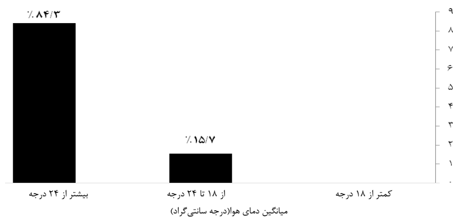
نمودار ۲: درصد فراوانی کلاس‌ها در هر محدوده دمایی