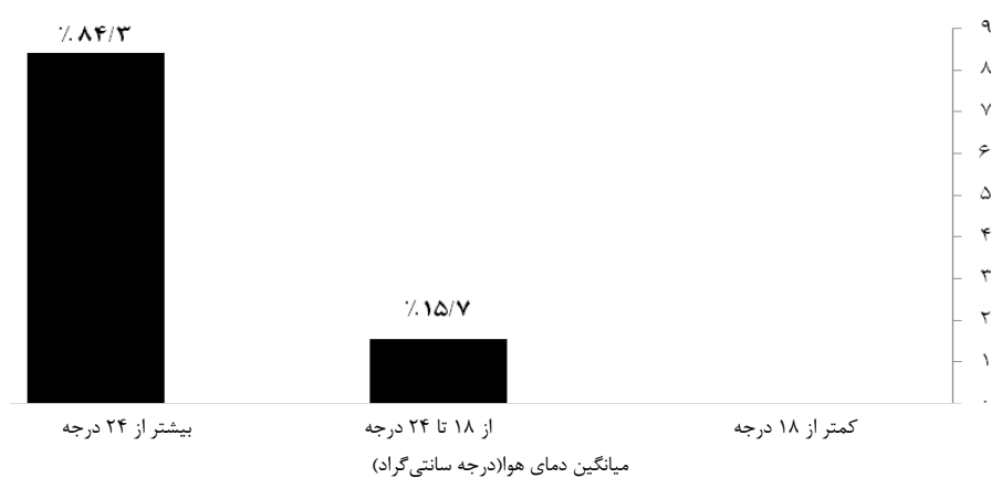
نمودار ۲: درصد فراوانی کلاس‌ها در هر محدوده دمایی