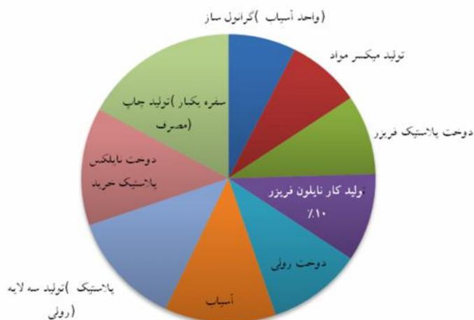
نمودار ۲: توزیع فراوانی اقدامات کنترلی پیشنهادی

به طور کلی در بین ۷۳ مورد اقدام کنترلی که می‌توان پیشنهاد داد، موثرترین روش‌های کنترل خطر در این شرکت عبارتند از روش‌های مدیریتی تهیه و توزیع و نظارت بر لوازم