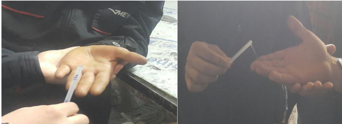
شکل ۱. آزمون حسی جهت تعیین سطح بی‌حسی در انگشتان دست کارگران مکانیک

کف هر دست افراد تست شد و فرد بدون نگاه به محل انجام آزمون با حس شماره مونوفیلانت جواب بله یا خیر می‌دهد. هر فیلامان سه بار با فاصله ۱۰ ثانیه‌ای تست شد و منطقه‌ای که بیشترین تغییرات را در تست حسی نشان