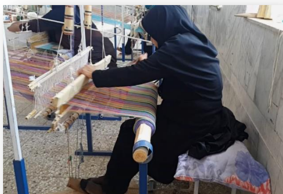
شکل ۱: ایستگاه کاری کاربافی

که در آن: n = تعداد وظایف دربردارنده ی حرکات تکراری اندام‌های فوقانی که در طی شیفت کاری انجام شده CF = ضریب ثابت تکرار فعالیت‌های تکنیکی در هر دقیقه، که بر اساس یک رفرنس بکار رفته است. Fa ، Fp و Ff = فاکتورهای ضریب، با رنج نمرات در محدوده ی بین ۰ و ۱؛ که براساس رفتار عوامل ریسک «نیرو» (Ff)، «وضعیت بدنی» (Fp) و «عناصر و اجزاء و