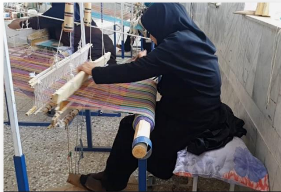
شکل ۱: ایستگاه کاری کاربافی

که در آن: n = تعداد وظایف دربردارنده ی حرکات تکراری اندام‌های فوقانی که در طی شیفت کاری انجام شده CF = ضریب ثابت تکرار فعالیت‌های تکنیکی در هر دقیقه، که بر اساس یک رفرنس بکار رفته است. Fa ، Fp و Ff = فاکتورهای ضریب، با رنج نمرات در محدوده ی بین ۰ و ۱؛ که براساس رفتار عوامل ریسک «نیرو» (Ff)، «وضعیت بدنی» (Fp) و «عناصر و اجزاء و