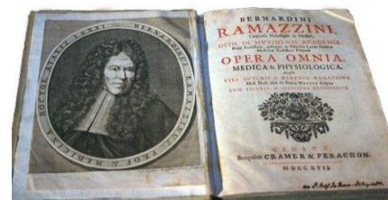
شکل ۱- رساله برناردینو رامازینی

طب کار رشته‌ای تخصصی است با وظایف گوناگون، که با رشته‌های بهداشت حرفه‌ای، ایمنی، ارگونومی، سم‌شناسی، اپیدمیولوژی، روان‌شناسی و پرستاری ارتباط متقابل و تعامل و با سایر تخصص‌های پزشکی (به ویژه ریه، گوش و حلق و بینی، پوست، روماتولوژی، ارتوپدی، توانبخشی و روانپزشکی) همبستگی دارد. برای موفق بودن در طب کار لازم است اصول پیشگیرانه و اصول روانی - اجتماعی با دید بالینی و تشخیصی و نوآوری در درمان تلفیق شود. توجه به تاریخ پزشکی در رشته‌های گوناگون در درک نحوه دستیابی به پیشرفت‌های آن رشته تأثیر بسزایی دارد. در این مقاله خلاصه‌ای از تاریخچه طب کار و پیشرفت‌های آن از آغاز توجه به مسایل شغلی در بیماری‌ها بیان شده است.