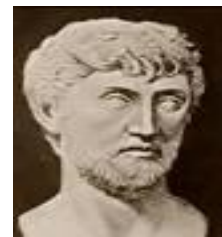
شکل ۲- تصویر منتسب به لوکرتیوس

لوکرتیوس که فیلسوفی در علوم طبیعی بود (شکل ۲) در مورد معدن‌کاران نوشت (۱،۸): «آیا نمی‌بینید که آنها پس از دوره‌ای کوتاه نیروی حیاتی‌شان تحلیل می‌رود و هلاک می‌شوند؟»