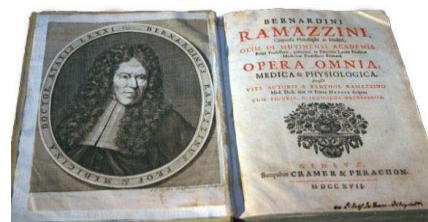
شکل ۱- رساله برناردینو رامازینی

طب کار رشته‌ای تخصصی است با وظایف گوناگون، که با رشته‌های بهداشت حرفه‌ای، ایمنی، ارگونومی، سم‌شناسی، اپیدمیولوژی، روان‌شناسی و پرستاری ارتباط متقابل و تعامل و با سایر تخصص‌های پزشکی (به ویژه ریه، گوش و حلق و بینی، پوست، روماتولوژی، ارتوپدی، توانبخشی و روانپزشکی) همبستگی دارد. برای موفق بودن در طب کار لازم است اصول پیشگیرانه و اصول روانی - اجتماعی با دید بالینی و تشخیصی و نوآوری در درمان تلفیق شود. توجه به تاریخ پزشکی در رشته‌های گوناگون در درک نحوه دستیابی به پیشرفت‌های آن رشته تأثیر بسزایی دارد. در این مقاله خلاصه‌ای از تاریخچه طب کار و پیشرفت‌های آن از آغاز توجه به مسایل شغلی در بیماری‌ها بیان شده است.