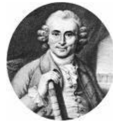
شکل ۱۲- جیمز لیند

۱. جیمز لیند (James Lind) (۱۷۱۶-۱۷۹۴) (شکل ۱۲)، پدر طب دریانوردی که به علت تجربیاتش در پیشگیری از بیماری اسکوروی در دریانوردان معروف شده است (۱۹).