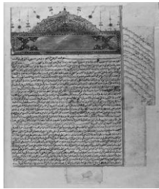
شکل ۹- کتاب ذخیره خوارزمشاهی

"مضرات‌هایی دیگر همچون وسواس (Obsession)، مالمخولیا، غفلت، کندفهمی، رای ناصواب، خیرگی چشم، ترسیدن در خواب، بیداری بی‌سببی، سکتته، رعشه، تفرس و فالج (فلج)".