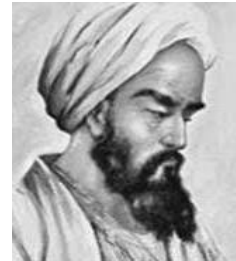
شکل ۴- تصویر منتسب به رازی

فقرا معروف است. جالب توجه است که در بسیاری از بیمارانی که او با جزئیات شرح داده است، به شغل بیمار نیز توجه کرده و آن را ذکر کرده است (تاجر پنبه، تاجر پارچه، طلاساز، کتاب‌فروش و....)، کتاب‌های او ترجمه شده و قرن‌ها در دانشگاه‌های اروپا تدریس می‌شد (۱۱، ۱).