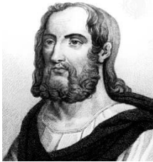
شکل ۳- تصویر منتسب به پلینی بزرگ

بدنه چاه عمیق می‌شود، دمه‌های گوگرد یا زاج به مقنیان می‌رسد و آنها را می‌کشد». او همچنین در مورد ماسک‌هایی که از مثانه حیوانات ساخته می‌شد و برای محافظت معدن‌کاران به کار می‌رفت نوشته است (۸).