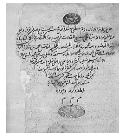
شکل ۵- تصویر صفحه اول کتاب الحاوی