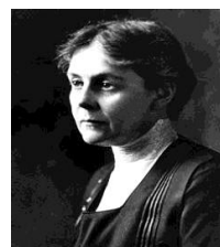
شکل ۱۴- آلیس همیلتون، مادر طب کار

۲. Alice Hamilton (۱۸۶۹-۱۹۷۰)، اگر Ramazzini پدر طب کار است، Alice Hamilton را به راستی می‌توان مادر طب کار نامید (۲۴)(شکل ۱۴).