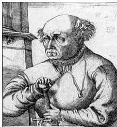
شکل ۱۰- پاراسلسوس

تئوفراستوس بومباستون فون هونهنه‌ایم (Theophrastus Bombastus von Hohenheim) (شکل ۱۰)، معروف به پاراسلسوس نظریه «دوز سم می‌سازد» را ابراز کرد، یعنی هر ماده‌ای سم است، دوز صحیح سم را از دارو جدا می‌کند.