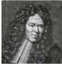
شکل ۱۱- برناردینو رامازینی

ورزش و تغییر وضعیت بدن و همچنین شست و شوی دست‌ها و صورت را پس از اتمام کار توصیه می‌کرد. او در برخی موارد در کارگرانی که مبتلا به مشکلات تنفسی می‌شدند، توصیه به تغییر شغل می‌کرد.