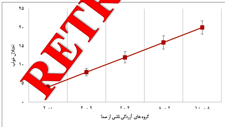
نمودار ۲. مقایسه اختلالات خواب در بین گروه های آزردهی ناشی از صدا

نتایج آزمون کروسکال - والیس نشان می دهد که میانگین نمره اختلال خواب در بین گروه های شغلی از اختلال معنی داری برخوردار است (P-value < ۰/۰۵). هم چنین با توجه به نتایج آنالیز واریانس می توان اظهار کرد که اختلال خواب در بین گروه های سنی و بر اساس سابقه کار، دارای اختلاف معناداری است (P-value < ۰/۰۵).