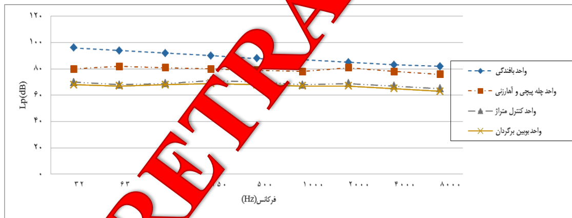
نمودار ۱. آنالیز فرکانس صوت در اکتاو باند به تفکیک گروه‌های شغلی

* میانگین \pm انحراف معیار † تعداد (درصد)