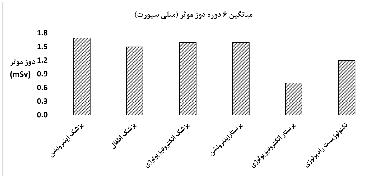
شکل ۱. نمودار مربوط به توزیع دوز موثر سالیانه (میلی سیورت) بر اساس داده‌های ۴ ساله برای گروه‌های مختلف پرتوکاری در بخش آنژیوگرافی

که چه تعداد از پرتوکاران در طول سال میزان دوز مشخصی را دریافت نموده‌اند یعنی به‌طور مثال ۹ نفر از پرتوکاران دوزی معادل ۲ میلی سیورت در سال دریافت می‌نمایند. همچنین می‌توان دریافت که تعداد افرادی که