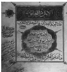
شکل ۷- تصویر صفحه اول نسخه اصلی کتاب قانون فی الطب

"علل فاعلی موجبات و عواملی است که تن آدمی را نگه می‌دارند و یا تغییر می‌دهند مانند هوا و متعلقات آن، غذاها، آب‌ها، آشامیدنی‌ها، تخلیه، احتقان، احتباس، محیط زیست، مسکن، فعالیت و استراحت، خواب، بیداری، تغییرات سنین عمر، جنسیت، پیشه، عادات، حرکات بدنی و چیزهای دیگری که با تن آدمی در تماس هستند و با طبیعت سازگار یا ناسازگارند.