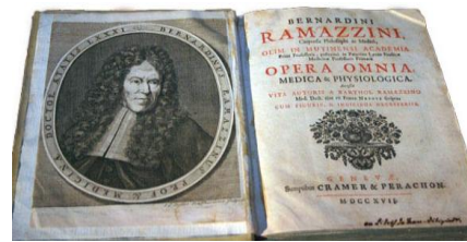
شکل ۱- رساله برناردینو رامازینی

طب کار رشته‌ای تخصصی است با وظایف گوناگون، که با رشته‌های بهداشت حرفه‌ای، ایمنی، ارگونومی، سم‌شناسی، اپیدمیولوژی، روان‌شناسی و پرستاری ارتباط متقابل و تعامل و با سایر تخصص‌های پزشکی (به ویژه ریه، گوش و حلق و بینی، پوست، روماتولوژی، ارتوپدی، توانبخشی و روانپزشکی) همبستگی دارد. برای موفق بودن در طب کار لازم است اصول پیشگیرانه و اصول روانی - اجتماعی با دید بالینی و تشخیصی و نوآوری در درمان تلفیق شود. توجه به تاریخ پزشکی در رشته‌های گوناگون در درک نحوه دستیابی به پیشرفت‌های آن رشته تأثیر بسزایی دارد. در این مقاله خلاصه‌ای از تاریخچه طب کار و پیشرفت‌های آن از آغاز توجه به مسایل شغلی در بیماری‌ها بیان شده است.