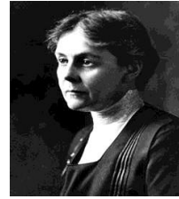
شکل ۱۴- آلیس همیلتون، مادر طب کار

۲. Alice Hamilton (۱۸۶۹-۱۹۷۰)، اگر Ramazzini پدر طب کار است، Alice Hamilton را به راستی می‌توان مادر طب کار نامید (۲۴) (شکل ۱۴).