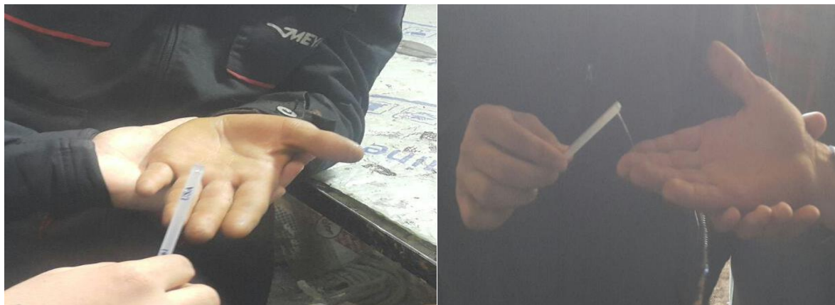
شکل ۱. آزمون حسی جهت تعیین سطح بی‌حسی در انگشتان دست کارگران مکانیک

کف هر دست افراد تست شد و فرد بدون نگاه به محل انجام آزمون با حس شماره مونوفیلانت جواب بله یا خیر می‌دهد. هر فیلامان سه بار با فاصله ۱۰ ثانیه‌ای تست شد و مناطقی که بیشترین تغییرات را در تست حسی نشان