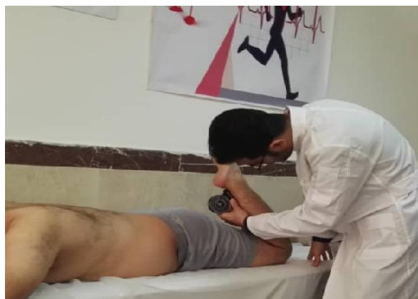
شکل ۲. ارزیابی دامنه حرکتی فلکشن زانو در وضعیت دمر