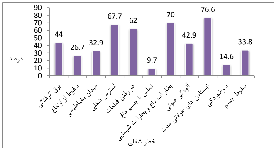
شکل ۲. درصد توزیع فراوانی انواع خطرات شناسایی شده