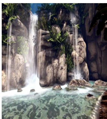
شکل ۲: تماشای آبشار در جنگل

جلسه اول: در این مرحله شرکت‌کنندگان با محتوای بسته آموزش واقعیت مجازی آشنا شدند و نحوه انجام جلسات برای افراد تشریح گردید. جلسه دوم: در این جلسه محیط آرامش‌بخش قرار گرفتند و کاربر توسط عینک واقعیت مجازی در یک محیط مانند تماشای آبشار در جنگل قرار گرفت. جلسه سوم: در این مرحله، فرد ادامه حضور در تماشای آبشار در جنگل را تجربه کرد و به تمرین حضور در یک محیط آرامش‌بخش پرداخت. جلسه چهارم: در جلسه چهارم کاربر در یک جو دوستانه و پرنشاط در محیط شغلی به‌صورت مجازی قرار گرفت. جلسه پنجم: در این مرحله فرد، ادامه حضور در یک جو دوستانه و پرنشاط در محیط شغلی را تجربه کرد و به تمرین حضور در این محیط پرداخت. جلسه ششم: در مرحله ششم فرد در یک مجلس دورهمی و مهمانی شرکت کرد. جلسه هفتم: در مرحله هفتم، کاربر ادامه شرکت در یک مجلس دورهمی و مهمانی را تجربه کرد. جلسه هشتم: در جلسه دوازدهم، نتایج جلسات قبلی بررسی و راهکارها و پیشنهادات مبتنی بر بسته آموزشی واقعیت مجازی ارائه گردید.