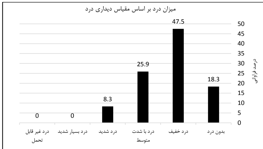
نمودار ۲: نتایج پرسشنامه مقیاس دیداری درد تکمیل شده توسط شرکت کنندگان در مطالعه