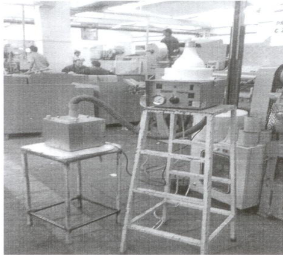
شکل ۱- دستگاه نمونه‌برداری در حال نمونه‌برداری از هوای داخل سالن

ابتدا پلیت‌ها و کلیه وسایل نمونه‌برداری به وسیله الکل اتیلیک ۹۶٪ تمیز و استریل شده و به مدت ۱۵ دقیقه در دمای ۱۳۴ درجه سانتی‌گراد درون اتوکلاو قرار گرفته تا استریل شوند. حجم نمونه برای برآورد میانگین از فرمول n = \frac{2(Z_{1-\alpha/2} + Z_{1-\beta})^2 S^2}{d^2} به دست آمد (۲۰). تعداد نمونه‌های محیطی با استفاده از روش مذکور در هر