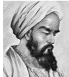
شکل ۴- تصویر منتسب به رازی

فقرا معروف است. جالب توجه است که در بسیاری از بیمارانی که او با جزئیات شرح داده است، به شغل بیمار نیز توجه کرده و آن را ذکر کرده است (تاجر پنبه، تاجر پارچه، طلاساز، کتاب‌فروش و....)، کتاب‌های او ترجمه شده و قرن‌ها در دانشگاه‌های اروپا تدریس می‌شد (۱۱، ۱).