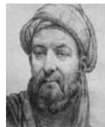
شکل ۶- حسین بن عبدالله مشهور به ابوعلی سینا

ابوعلی حسین بن عبدالله بن سینا، مشهور به ابوعلی سینا، ابن‌سینا و پورسینا پزشک و شاعر ایرانی و از مشهورترین و تاثیرگذارترین فیلسوفان و دانشمندان ایران است (شکل ۶) که به ویژه به دلیل آثارش در زمینه فلسفه ارسطویی و پزشکی اهمیت دارد. جرج سارتن در کتاب تاریخ علم، وی را یکی از بزرگترین اندیشمندان و دانشمندان پزشکی و همچنین مشهورترین دانشمند ایران می‌داند.