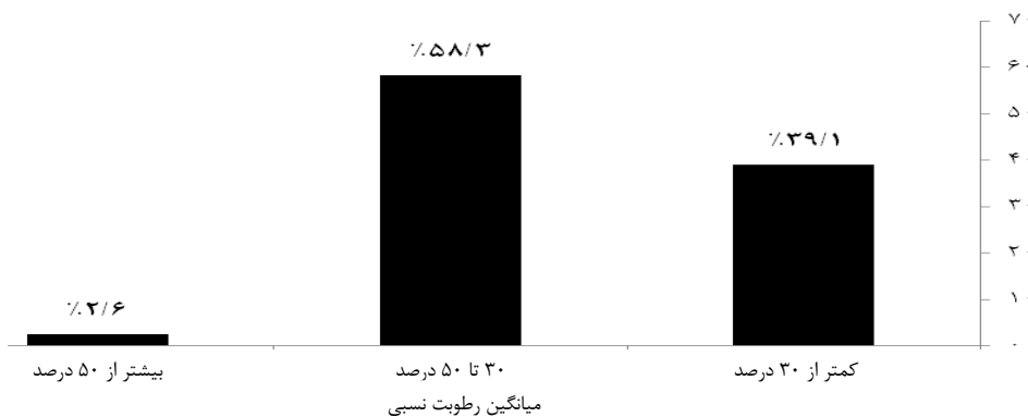
نمودار ۳: درصد فراوانی کلاس‌ها در هر محدوده از رطوبت نسبی