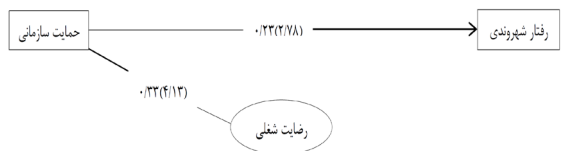
نمودار ۳. الگوی تأیید شده رفتار شهروندی

باتوجه به نتایج مندرج در جدول ۴، شاخص‌های کلی آزمون الگوی پیشنهادی تعدیل شده، حاکی از برازش کلی این الگو است ( AGFI=0/94 , GFI=0/99 , RMSEA=0/09 , df/\chi^2 = 2/13 ) و ( CFI=0/95 ). به منظور برازش الگو ضروری است که شاخص‌های فوق استانداردهای لازم را داشته باشند. چنانچه مقدار شاخص df/\chi^2 کوچکتر از ۳ باشد، مقدار RMSEA از ۰/۱ کوچکتر باشد و همچنین شاخص‌های برازش AGFI ، GFI و CFI به یک نزدیک‌تر باشند، بیانگر آن است که الگوی پیشنهادی تأیید شده است. بنابراین با توجه به این که شاخص‌های مذکور در جدول فوق استانداردهای مورد نظر را دارند، می‌توان ادعا داشت که الگوی پیشنهادی تعدیل شده در این پژوهش مورد تأیید قرار گرفته است. اما شاخص‌های تولیدی تحلیل مسیر فقط محدود به شاخص‌های برازش کلی الگو نیست؛ بلکه پارامتر ضریب مسیر و مقادیر t متناظر با آنها برای هر یک از مسیرهای علی از متغیر برون‌زا به متغیر میانجی و درون‌زا، و از متغیر میانجی به متغیر درون‌زا نیز وجود دارد. این ضرایب، قدرت نسبی هر مسیر را نشان می‌دهد. این ضرایب مسیر و مقدار t متناظر با آنها در نمودار ۳ ارائه شده است. (ضرایب مسیر و مقادیر t داخل پرانتز). کلیه این ضرایب در سطح ۰/۰۵ معنادار می‌باشد.