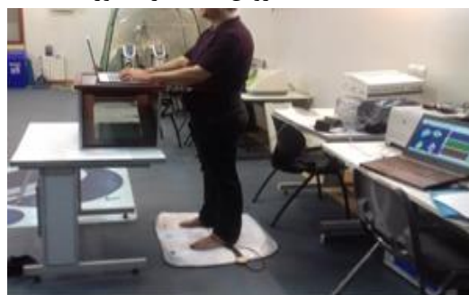
شکل ۱. ارزیابی فشار کف پای بر روی کفپوش ارگونومیک

شرکت کنندگان آموزش داده شد که به صورت عادی بایستند، از محیط تعیین شده خارج نشوند، به میز تکیه ندهند و همچنین برای حمایت وزن بدن با دست به میز تکیه ندهند. در ادامه افراد شرکت کننده شروع به تایپ کردن به عنوان یک وظیفه شغلی سبک شدند و در ۳۰ ثانیه پایانی فشار میانگین نقاط آناتومیکی ذکر شده ثبت شد. البته برای جلوگیری از خستگی افراد و همچنین کاهش خطا در ثبت نتایج فشار کف پا در کفپوش بعدی، شرکت کنندگان به مدت ۳۰ دقیقه استراحت می‌کردند، تمام شرکت کنندگان در طول آزمون پابرهنه بودند. برای تجزیه و تحلیل داده‌های گردآوری شده از نرم‌افزار spss نسخه ۲۰ استفاده شد. روش‌های آماری مورد استفاده در