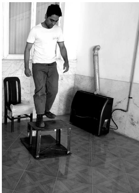
شکل ۱. اجرای تست پله در بین کارکنان شرکت سیمان

Vo 2 max استفاده شد. برای بررسی عوامل پیش‌بینی‌کننده WAI، از رگرسیون خطی چندگانه استفاده شد.