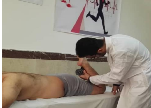
شکل ۲. ارزیابی دامنه حرکتی فلکشن زانو در وضعیت دمر