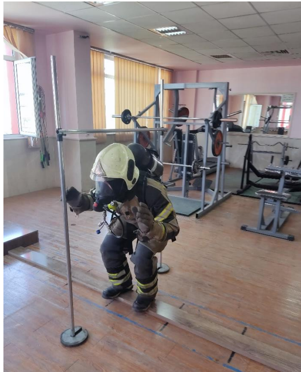
شکل ۲: تخته تعادل عملکردی آتش نشانان