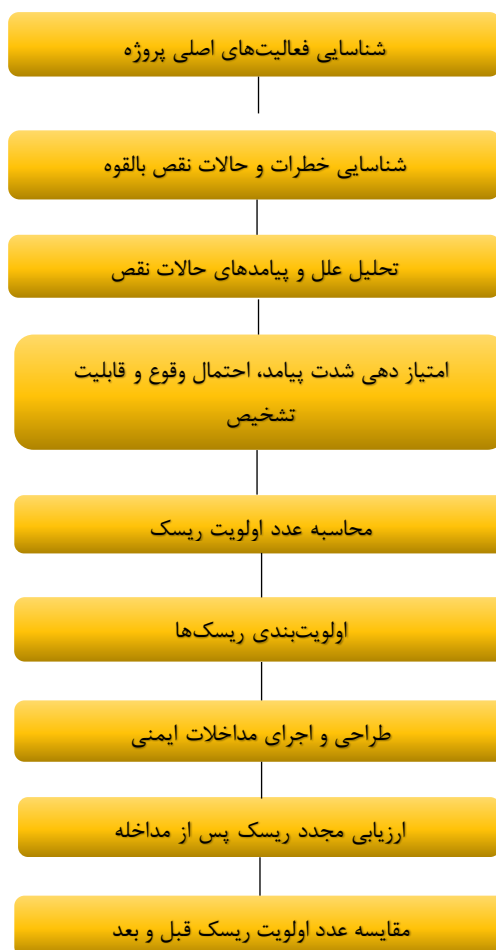
شکل ۱: مراحل اجرای ارزیابی ریسک و بررسی اثربخشی مداخلات ایمنی در پروژه ساخت‌وساز فولادی با استفاده از روش FMEA

نمودار شماتیک ارائه شد. همان‌گونه که در شکل ۱ مشاهده می‌شود، فرآیند مطالعه شامل شناسایی فعالیت‌های اصلی پروژه، استخراج خطرات و حالات نقص بالقوه، تحلیل علل و پیامدها، امتیازدهی شاخص‌های شدت پیامد، احتمال وقوع و قابلیت تشخیص، محاسبه عدد اولویت ریسک (RPN)،