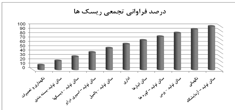
نمودار ۱- درصد فراوانی تجمعی ریسک‌ها به تفکیک واحدهای کاری

سپس برای کلیه خطرات، اقدامات اصلاحی لازم ارائه گردید. در بعضی از موارد که عدد ریسک بالا بود، در مورد خطر مربوطه، سناریوی مناسب تدوین و پس از اجرای مانور، توسط تیم کارشناسی نمرات ریسک برآورد گردید. اقدامات اصلاحی در دو گروه مدیریتی و مهندسی (طراحی، فردی) ارائه شد که از اقدامات مهندسی می‌توان به نورسنجی، تامین روشنایی، اصلاح صندلی و... و از اقدامات مدیریتی نیز به بررسی، اجرا و تدوین دستورالعمل‌های ایمنی کار، نظارت بر داشتن و یا صدور کارت بهداشت کارگران و... اشاره کرد و سپس اقدامات اصلاحی و پیشگیرانه به اجرا درآمد (۱۱). پس از گذشت ۴ ماه از اجرای اقدامات اصلاحی، بار دیگر سیستم مورد ارزیابی قرار گرفت و بدین ترتیب کد ارزیابی ریسک ۲ (RAC2) محاسبه گردید.