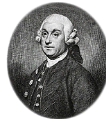
شکل ۱۳- پرسیوال پات

۳. پرسیوال پات (Pott Percival) (۱۷۱۴-۱۷۸۸) (شکل ۱۳)، تشخیص کانسر اسکروتوم در دوده پاک‌کن‌ها و ارتباط دادن آن به مواجهه با دوده، او را پیشگام اپیدمیولوژی مشاهده‌ای و همچنین پدر سرطان‌زایی محیطی می‌دانند (۲۰).