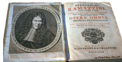
شکل ۱- رساله برناردینو رامازینی

طب کار رشته‌ای تخصصی است با وظایف گوناگون، که با رشته‌های بهداشت حرفه‌ای، ایمنی، ارگونومی، سم‌شناسی، اپیدمیولوژی، روان‌شناسی و پرستاری ارتباط متقابل و تعامل و با سایر تخصص‌های پزشکی (به ویژه ریه، گوش و حلق و بینی، پوست، روماتولوژی، ارتوپدی، توانبخشی و روانپزشکی) همبستگی دارد. برای موفق بودن در طب کار لازم است اصول پیشگیرانه و اصول روانی - اجتماعی با دید بالینی و تشخیصی و نوآوری در درمان تلفیق شود. توجه به تاریخ پزشکی در رشته‌های گوناگون در درک نحوه دستیابی به پیشرفت‌های آن رشته تأثیر بسزایی دارد. در این مقاله خلاصه‌ای از تاریخچه طب کار و پیشرفت‌های آن از آغاز توجه به مسایل شغلی در بیماری‌ها بیان شده است.