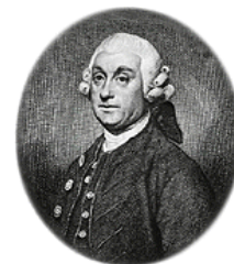
شکل ۱۳- پرسسیوال پات

۳. پرسسیوال پات (Pott Percival) (۱۷۱۴-۱۷۸۸) (شکل ۱۳)، تشخیص کانسر اسکروتوم در دوده پاک‌کن‌ها و ارتباط دادن آن به مواجهه با دوده، او را پیشگام اپیدمیولوژی مشاهده‌ای و همچنین پدر سرطان‌زایی محیطی می‌دانند (۲۰).