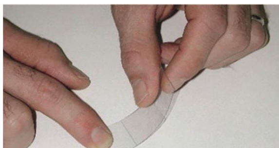
شکل ۲- نوارچسب حذف (۳۱)

Kammer و همکاران تکنیک نوار چسب حذف را برای اندازه‌گیری مواجهه پوستی با پایرن و بنزو آ پایرن مورد استفاده قرار دادند. آنها غلظت‌های معینی از بنزو آ