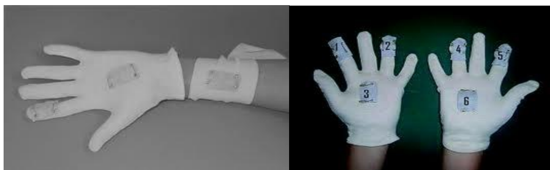
شکل ۴- نمونه‌برداری پیچ

هدف نمونه‌برداری پیچ تخمین مقدار موادی است که روی لباس، پوست و لایه‌های خارجی لباس جایگزین شده‌اند. نمونه‌برداری پیچ یک روش غیرفعال به حساب می‌آید قصد آن جمع‌آوری تمام مواد مورد نظر در طول دوره مواجهه است (شکل ۴). در پایان دوره نمونه‌برداری، وصله‌ها از روی لباس برداشته و در یک کیسه پلاستیکی یا شیشه‌ای بسته شده قرار می‌گیرد. نمونه می‌بایست تا انتقال به آزمایشگاه روی یخ نگهداری گردد (۴۶).