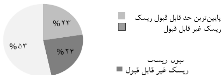
نمودار ۱: درصد ریسک‌های شناسایی شده قبل از مداخله

همچنین درصد ریسک‌های بعد از انجام مداخله به ۶۱ درصد در محدوده ریسک قابل قبول و ۳۹ درصد در محدوده پایین‌ترین حد ریسک قابل قبول تغییر یافت. نتایج در قالب نمودار ۲ مشخص می‌باشد: