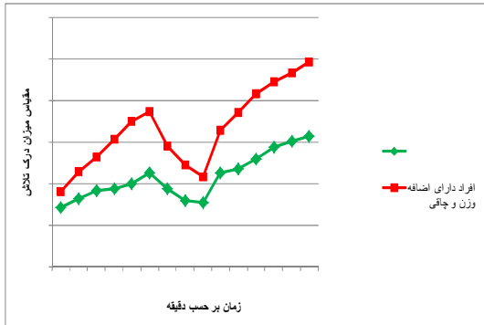
نمودار ۲: مقادیر میانگین مقیاس میزان درک تلاش در افراد دارای اضافه وزن و با وزن نرمال تحت شرایط خیلی گرم و شدت فعالیت سبک