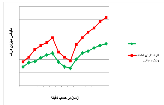
نمودار ۱: مقادیر میانگین مقیاس میزان درک تلاش در افراد دارای اضافه وزن و با وزن نرمال تحت شرایط گرم و شدت فعالیت متوسط

دارای وزن نرمال ( r=0/001, p<0/67 ). و در افراد دارای اضافه وزن و چاقی ( r=0/49, p=0/003 ) رابطه خطی مستقیم وجود دارد. همچنین در شرایط خیلی گرم و شدت فعالیت سبک بین ضربان قلب و مقیاس میزان درک تلاش در افراد دارای اضافه وزن و چاقی ( r=0/42, p=0/014 ) رابطه خطی مستقیم وجود دارد. ولی در شرایط خیلی گرم و شدت فعالیت سبک بین ضربان قلب و مقیاس میزان درک تلاش در افراد دارای وزن نرمال ( r=0/28, p>0/05 ) رابطه خطی وجود ندارد.