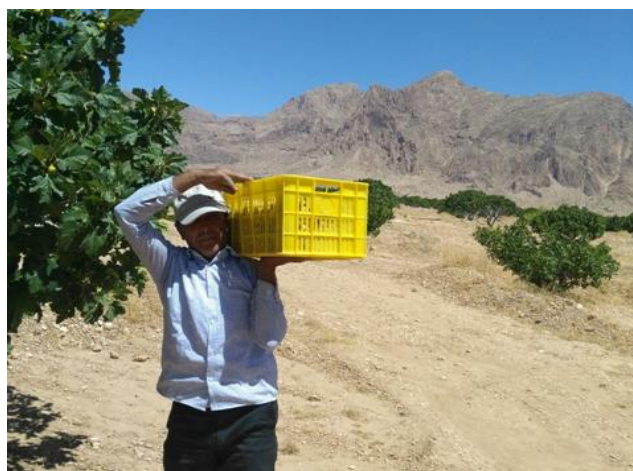
شکل ۳. کارگر در حین حمل ظرف به اسپنگ (جایگاه خشک کردن انجیر)