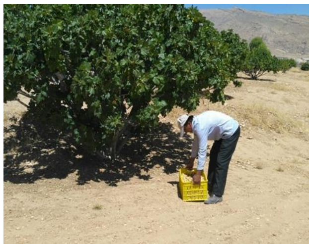
شکل ۲. کارگر در حال برداشتن سبد انجیر با پوسچر خمیده