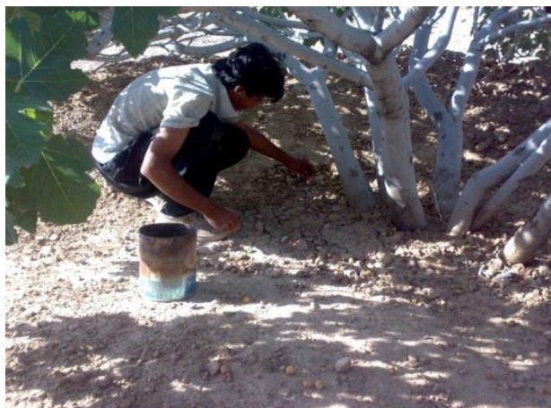
شکل ۱. کارگر در حال جمع‌آوری انجیر خشک زیر درخت

جهت ارزیابی خطر ابتلا به اختلالات اسکلتی عضلانی از روش PATH استفاده شد در روش PATH برای ارزیابی پوسچر تنه (۵ حالت)، گردن (۲ حالت)، پاها (۱۰ حالت)، دست‌ها (۳ حالت) و نیرو (۵ حالت) در نظر گرفته می-شود. کدهای استفاده شده برای هر یک از وضعیت‌های